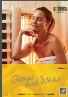
Prospekt Infrarotkabinen und Saunen